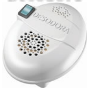
PURIFICADOR DE AR